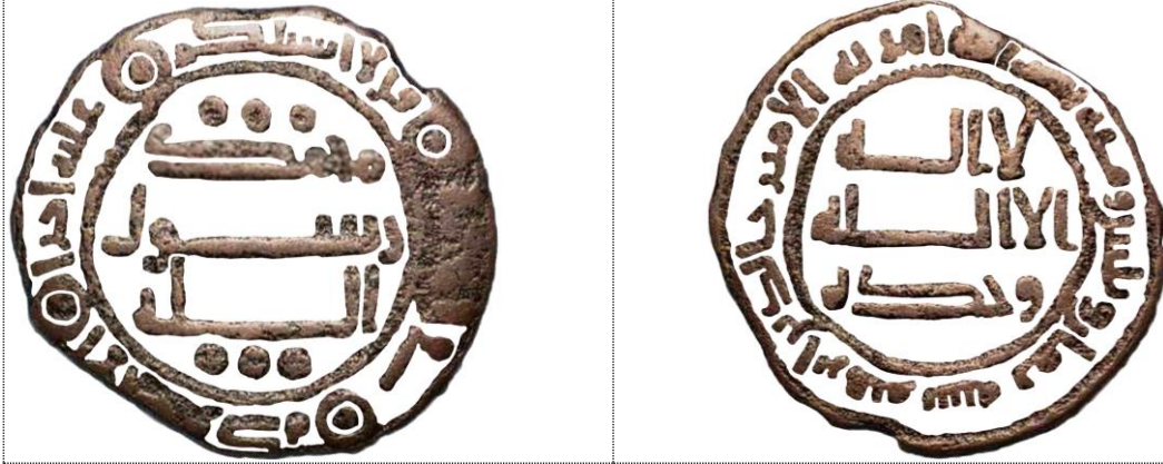
شكل (٢) تفرغ كتابات ونقوش فلس ضرب سنة ١٣٨هـ، باسم خالد بن إبراهيم، الوزن: ٧،١جم، القطر: ٢١ مم؛ عن Zeno, no. 241265، عمل الباحث

من خلال عرض محتويات هذا النمط يتضح أن هناك إشارات مهمة مقصودة من وراء تسجيل ما به من عبارات وزخارف، تتضح مما يلي: