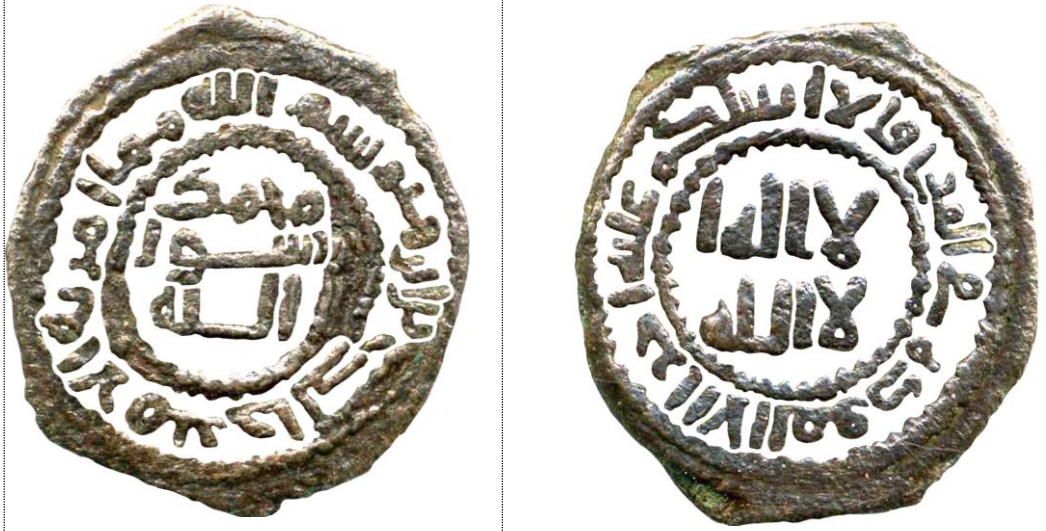
شكل (٤) تفرغ كتابات ونقوش فلس غير مسجل عليه مدينة ولا تاريخ الضرب، باسم خالد بن إبراهيم، الوزن: ١,٦٥ جم، القطر: ١٧ مم؛ عن Zeno, no. 152573، عمل الباحث

تتشابه النصوص الكتابية المسجلة على هذا النمط الى حد كبير مع النمطين السابقين.